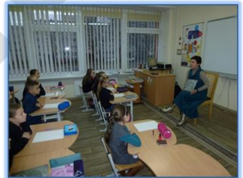
Susitikimo su rašytoja akimirkos

Dainams40Dainams40Dainams40 Dainams40Dainams40Dainams40Dainams40