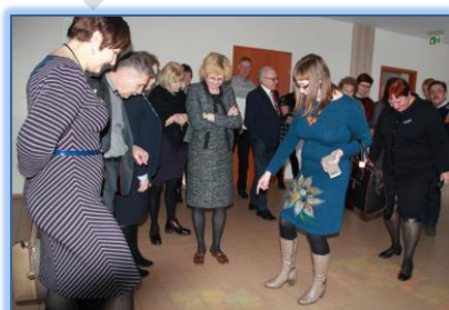
Svečiai progimnazijos edukacinėse erdvėse