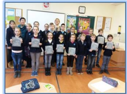
Rašytoja su 3d klasės mokiniais