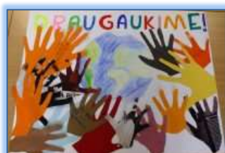
Pradinio ugdymo mokinių darbai