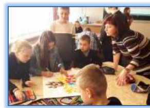
Veiklos pradinio ugdymo klasėse