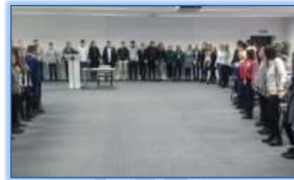
Tarptautinės tolerancijos dienos minėjimo popietėje Šiaulių universitete

Dainams40Dainams40Dainams40 Dainams40Dainams40Dainams40Dainams40