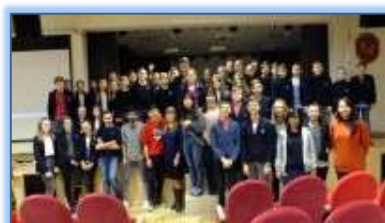
Susitikime su svečiais