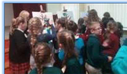
Mokiniai respublikinėje konferencijoje