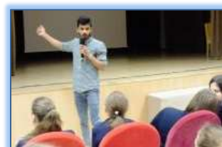
ŠU studijuojantis užsienietis